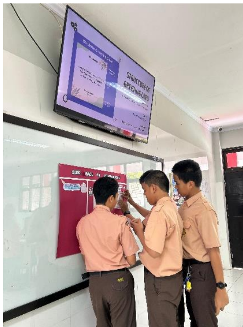
Gambar 8. Siswa menempel hasil kerjanya pada wall yang disediakan

Hasil kegiatan menunjukkan adanya peningkatan partisipasi siswa selama proses pembelajaran berlangsung. Siswa terlihat lebih antusias dalam mengikuti pembelajaran, lebih aktif menjawab pertanyaan, serta mulai berani menyampaikan pendapat di depan kelas. Selain itu,