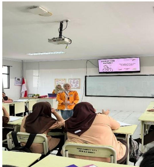
Gambar 2. Kegiatan Opening and engagement melalui ice breaking (2)

Setelah kegiatan pembuka, materi pembelajaran disampaikan menggunakan media seperti PowerPoint (PPT) dan Flipbook yang dikombinasikan dengan pertanyaan interaktif. Dalam proses ini, siswa didorong untuk aktif mengamati, menjawab pertanyaan, dan menyampaikan pendapat terkait materi yang sedang dipelajari. Penggunaan media pembelajaran interaktif membantu siswa lebih fokus dan antusias selama proses pembelajaran berlangsung.