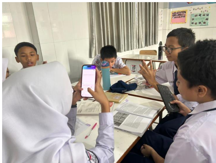
Gambar 5. Mahasiswa mendampingi siswa selama pengerjaan worksheet (2)

Selain pengerjaan worksheet, siswa juga diberikan kesempatan untuk mempresentasikan hasil diskusi dan menjawab pertanyaan di depan kelas. Aktivitas ini bertujuan untuk meningkatkan keberanian dan rasa percaya diri siswa dalam menggunakan Bahasa Inggris. Selama kegiatan berlangsung, terlihat bahwa siswa menjadi lebih aktif bertanya, berdiskusi, dan berpartisipasi dalam proses pembelajaran dibandingkan sebelum penerapan pendekatan Student-Centered Learning .