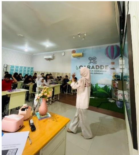
Gambar 3. Penyampaian materi menggunakan media PPT dan Flipbook (1)