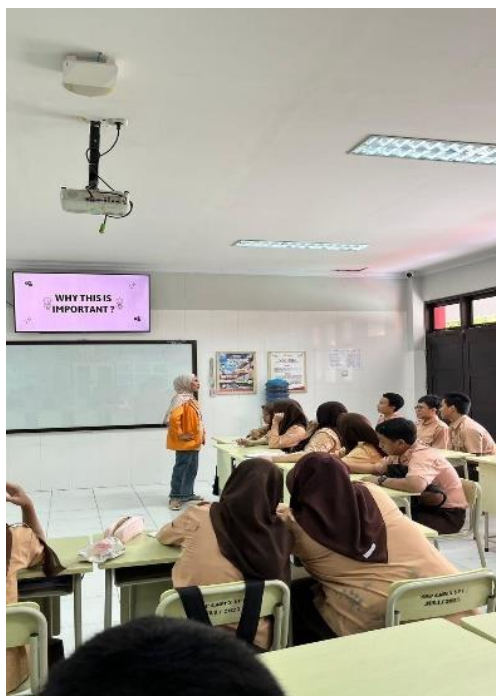
Gambar 4. Penyampaian materi menggunakan media PPT dan Flipbook (2)

Pada tahap berikutnya, siswa diberikan worksheet atau LKPD yang dikerjakan secara individu maupun kelompok. Pembagian kelompok dilakukan secara heterogen agar siswa dapat berdiskusi dan saling membantu dalam memahami materi pembelajaran. Dalam kegiatan ini, mahasiswa berperan sebagai fasilitator yang membimbing jalannya diskusi serta membantu siswa yang mengalami kesulitan selama pengerjaan tugas.