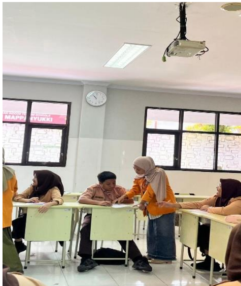
Gambar 5. Mahasiswa mendampingi siswa selama pengerjaan worksheet (1)