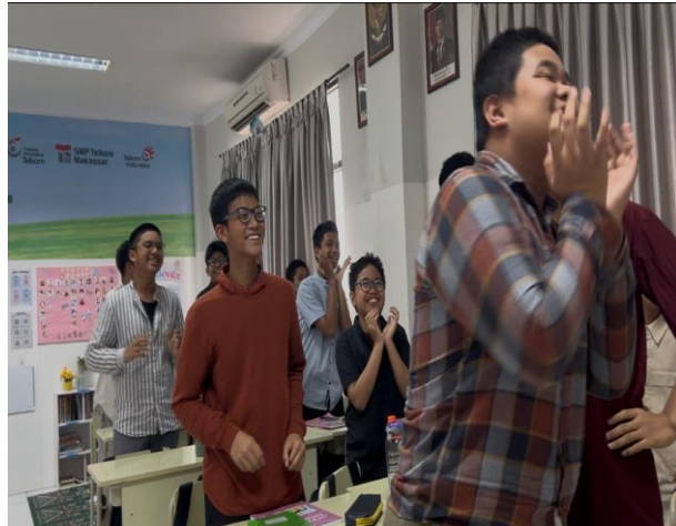
Gambar 1. Kegiatan Opening and engagement melalui ice breaking (1)