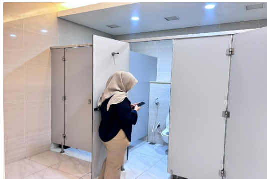
Gambar 2. Pengecekan fasilitas umum