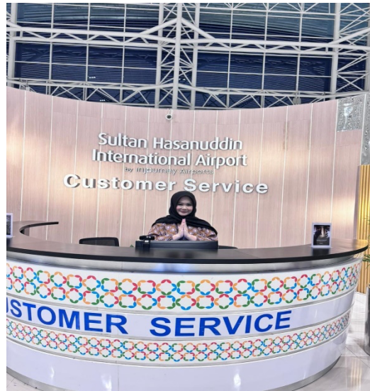
Gambar 1. Pelayanan customer service kepada penumpang