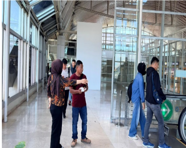
Gambar 4. Pengarahan penumpang di area transit

Pelayanan customer service memiliki peran penting dalam meningkatkan kenyamanan dan kepuasan penumpang di lingkungan bandara. Selama kegiatan magang berlangsung, penulis memahami bahwa pelayanan yang cepat, ramah, dan profesional dapat memberikan pengalaman positif bagi pengguna jasa bandara.