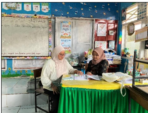
Gambar 5. Pembinaan Individu

Selama fase ini, fasilitator bekerja sama dengan guru, baik dengan mengamati secara saksama maupun berpartisipasi langsung dalam alur pembelajaran. Setelah pembelajaran, kedua belah pihak berpartisipasi dalam pengarahannya reflektif, membahas dinamika kelas, keputusan pembelajaran, respons peserta didik, dan area yang perlu diperbaiki. Tahap ini menekankan pertumbuhan kolaboratif, dialog terbuka, dan peningkatan praktis dalam praktik mengajar.