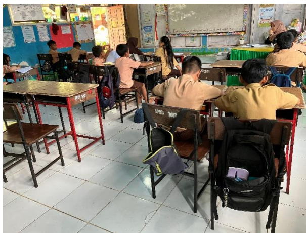
Gambar 3. Dialog observasi

Tahap ini melibatkan diskusi daring yang dilakukan melalui Zoom, di mana peserta dan fasilitator bertukar ide dalam format interaktif. Sesi ini menyediakan ruang untuk bertanya, berbagi perspektif, dan mengklarifikasi konsep-konsep kunci terkait pedagogi, pengajaran fonik, dan pendekatan komunikatif. Peserta berkontribusi secara aktif melalui masukan lisan, respons obrolan, dan refleksi kolaboratif, menciptakan lingkungan yang suportif untuk dialog terbuka dan pemahaman kolektif.