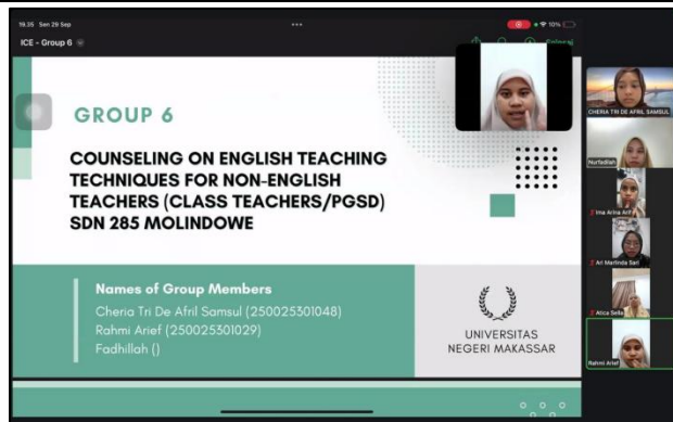
Gambar 2. Diskusi melalui zoom

Tahap ini melibatkan diskusi daring yang dilakukan melalui Zoom, di mana peserta dan fasilitator bertukar ide dalam format interaktif. Sesi ini menyediakan ruang untuk bertanya, berbagi perspektif, dan mengklarifikasi konsep-konsep kunci terkait pedagogi, pengajaran fonik, dan pendekatan komunikatif. Peserta berkontribusi secara aktif melalui masukan lisan, respons obrolan, dan refleksi kolaboratif, menciptakan lingkungan yang suportif untuk dialog terbuka dan pemahaman kolektif.