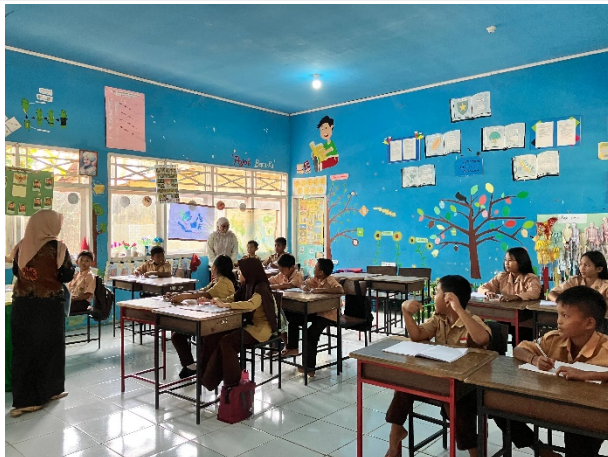
Gambar 4. Pengajaran bersama, dan umpan balik

Selama fase ini, fasilitator bekerja sama dengan guru, baik dengan mengamati secara saksama maupun berpartisipasi langsung dalam alur pembelajaran. Setelah pembelajaran, kedua belah pihak berpartisipasi dalam pengarahannya reflektif, membahas dinamika kelas, keputusan pembelajaran, respons peserta didik, dan area yang perlu diperbaiki. Tahap ini menekankan pertumbuhan kolaboratif, dialog terbuka, dan peningkatan praktis dalam praktik mengajar.