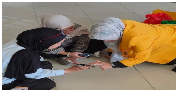
Gambar 4. Pendampingan pembuatan akun WordWall