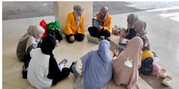
Gambar 3. Penguatan materi tehnik chunking dan media Wordwall