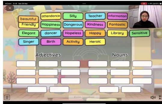
Gambar 2. Penggunaan media digital Wordwall