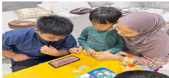
Gambar 5. Praktek mandiri oleh mentor